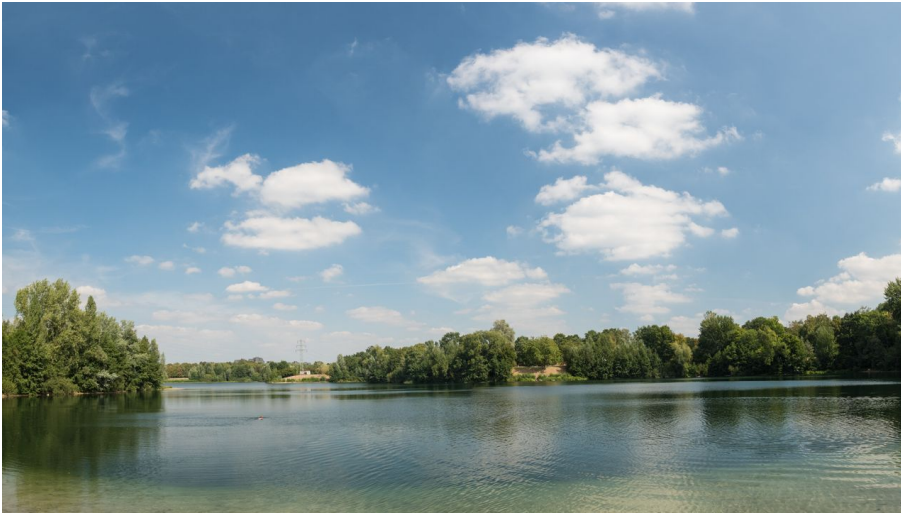
Silbersee und Grüner See im Erholungspark Volkardey in Ratingen