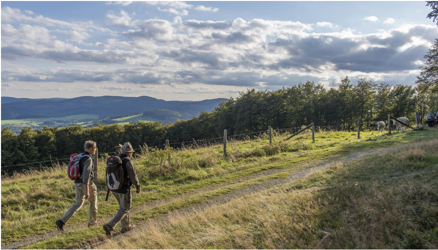
Zwei Wanderer vor toller Aussicht