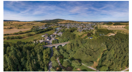
Panorama Willingen-Usseln