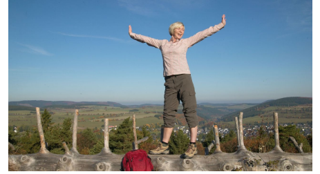
Frau auf Baumstamm mit toller Aussicht - © Tourist-Information Willingen