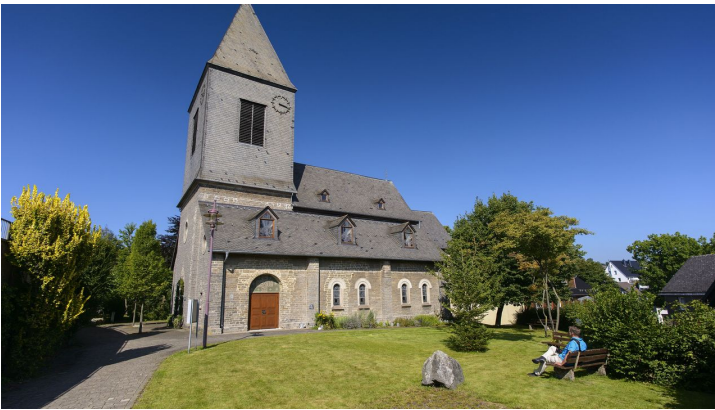
Kirche Usseln Außenansicht