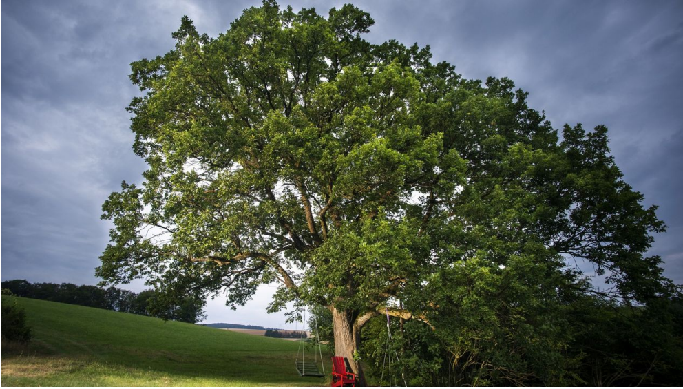
Eiche im Ohl bei Usseln