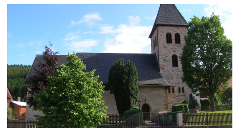
Kirche in Neerdar