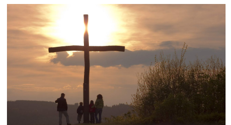
Gipfelkreuz bei Sonnenuntergang