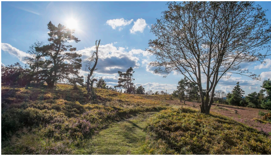
Uplandsteig - © Tourist-Information Willingen, Klaus-Peter Kappest