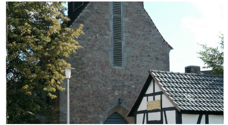
Kirche Wenzigerode