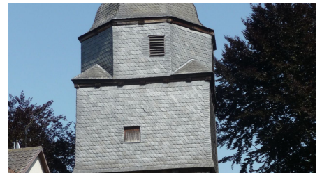
Kirche Niederurff - © Tourist-Info Bad Zwesten, Edersee | Deine Region: wild, bunt, gesund.