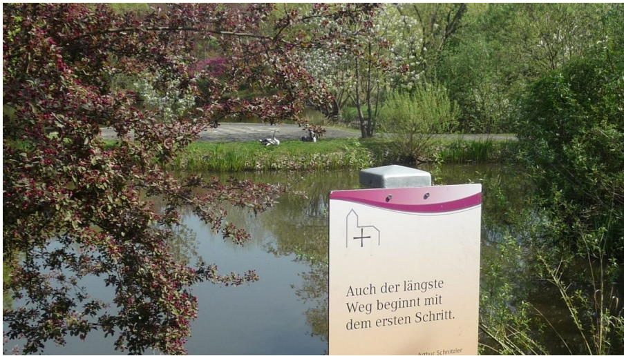
Zitatstafel Pilgerweg im Kurpark - © Tourist-Info Bad Zwesten, Edersee | Deine Region: wild, bunt, gesund.