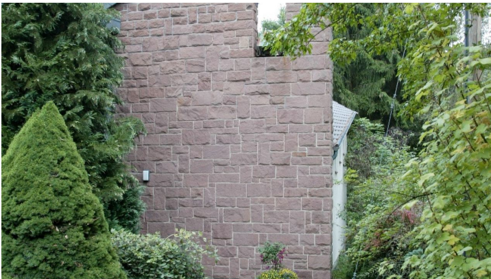
Kirche Betzigerode - © Tourist-Info Bad Zwesten, Edersee | Deine Region: wild, bunt, gesund.