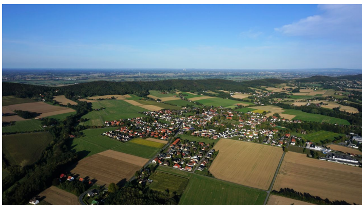
Hüllhorst Luftbild