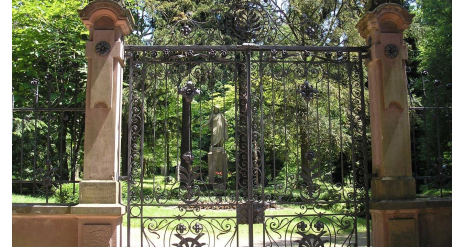
Illenauer Waldfriedhof