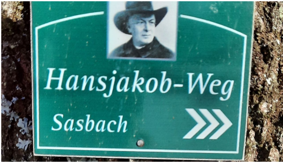
Wanderschild Hansjakob-Weg