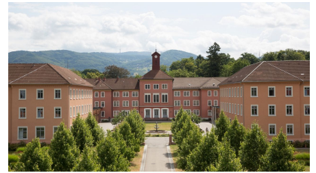
Tourismus Information Achern, Tourismus Information Achern