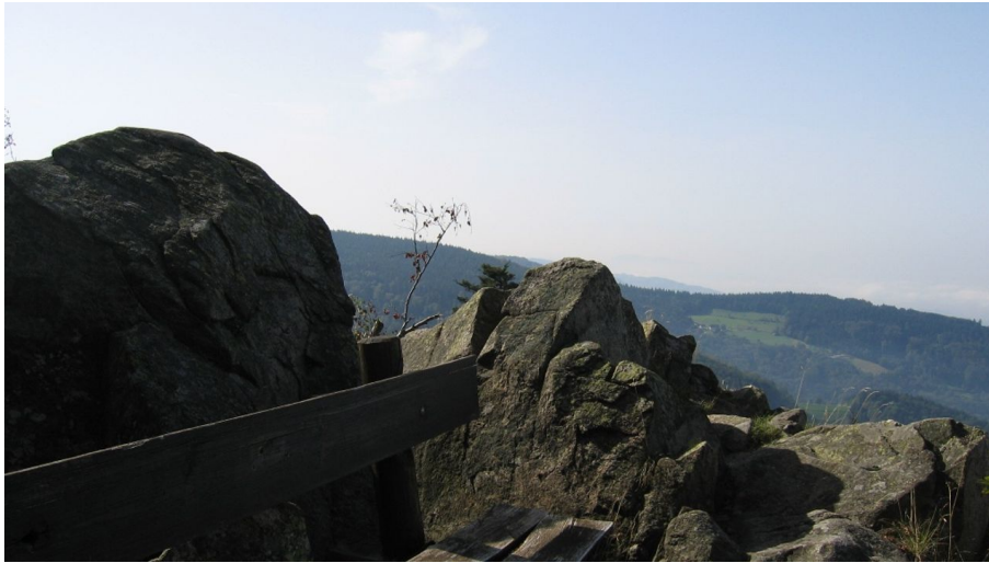
Blick vom Omerskopf