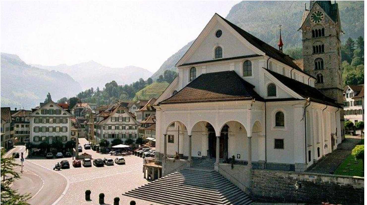
Pfarrkirche Stans