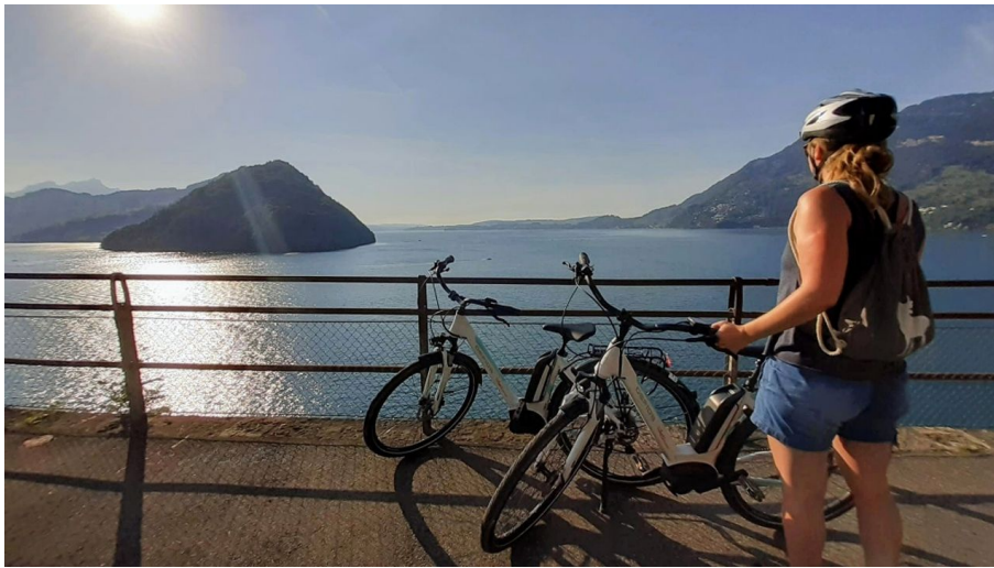
Tourist Information Weggis (Luzern Tourismus AG), Tourist Information Weggis