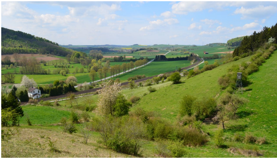
Blick von der Landschaftsliege Ottbergen