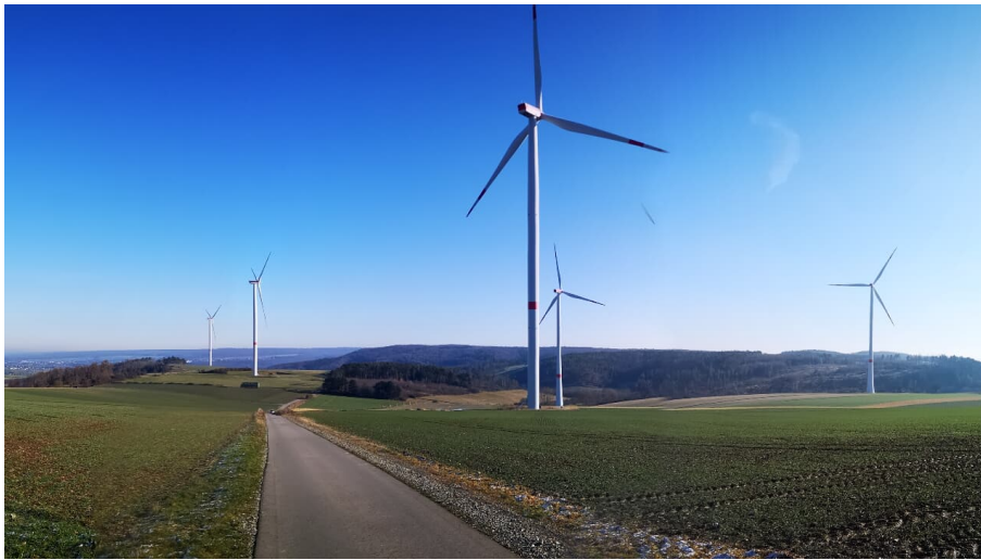
Windräder auf der Hüwe