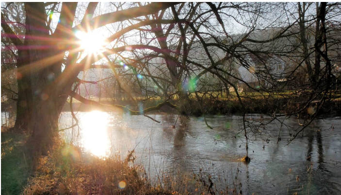
Nethe im Winter