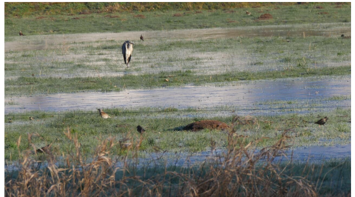
Überflutete Netheauen bei Ottbergen