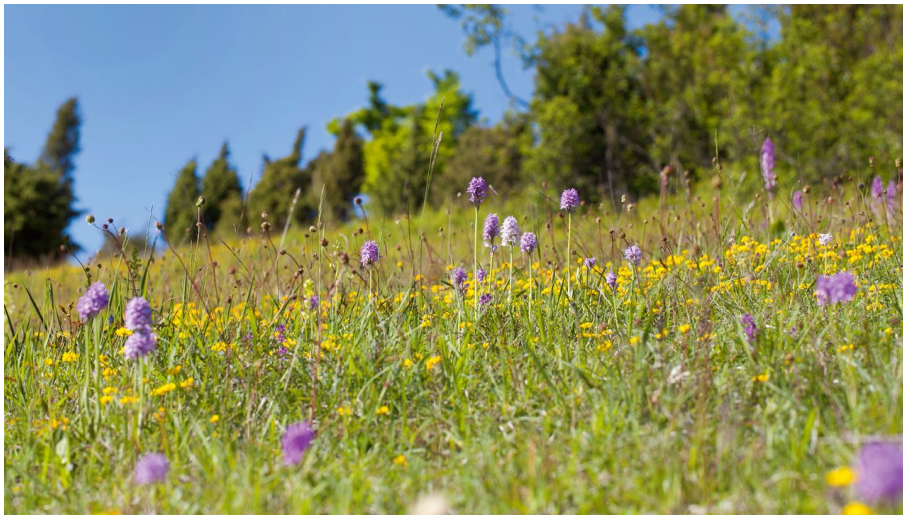
Kalkmagerrasen im Diemeltal