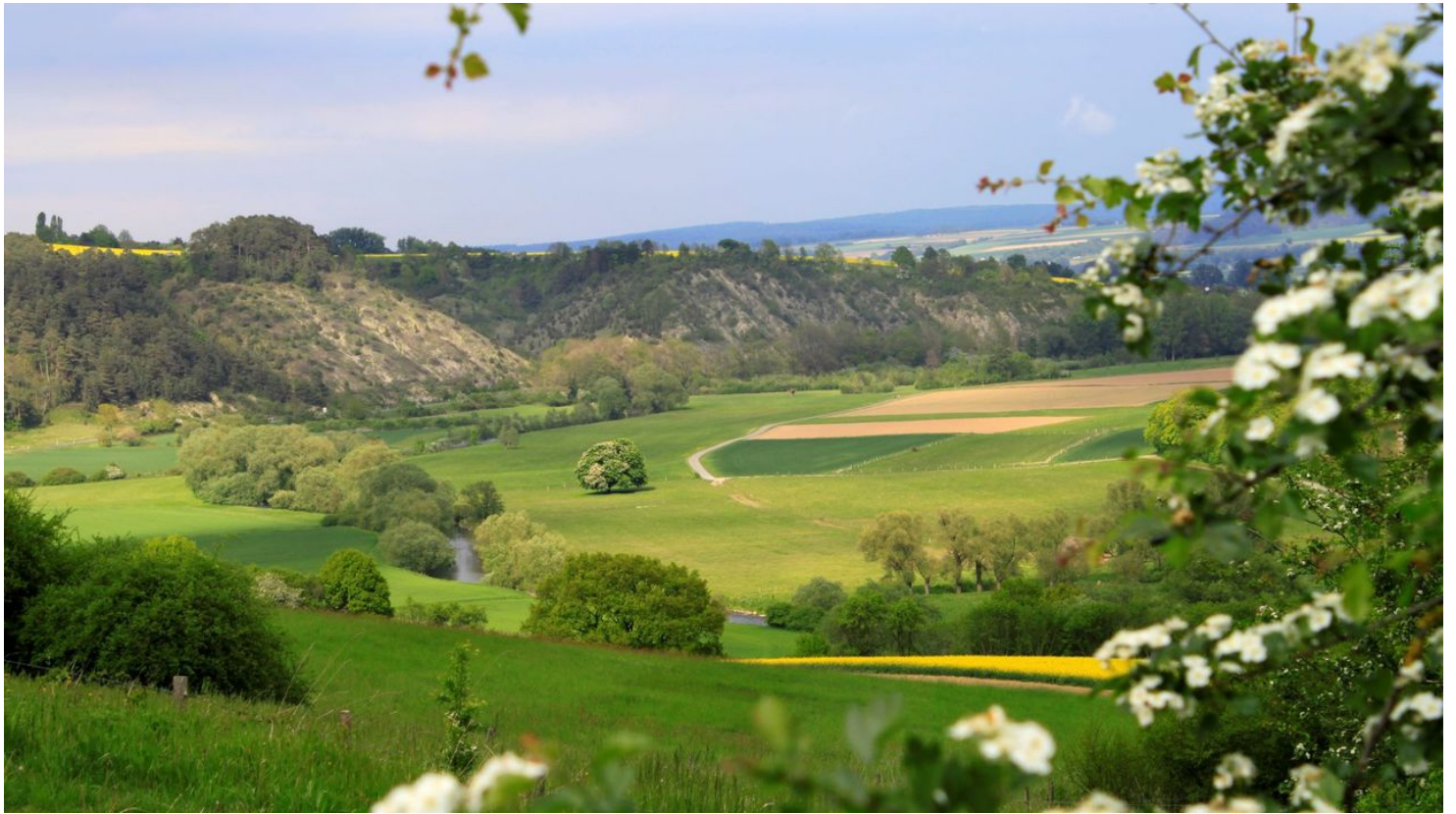
Aussicht Diemeltal