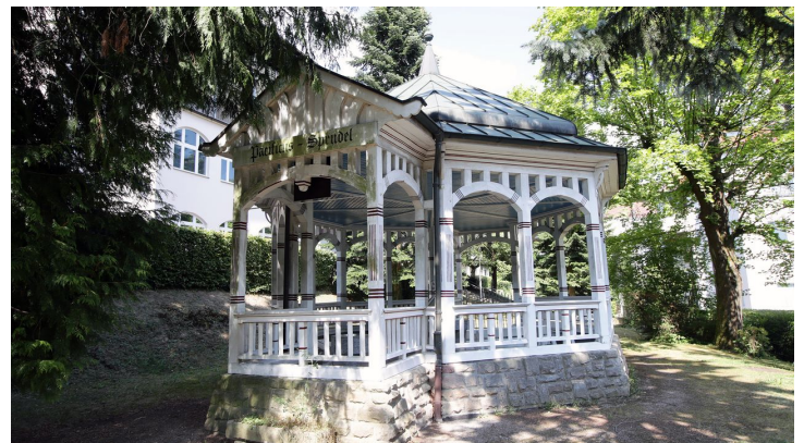
Bad Soden-Salmünster - Pacificus Sprudel