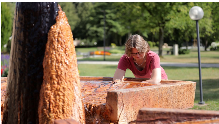
Bad Soden-Salmünster - König Heinrich Sprudel