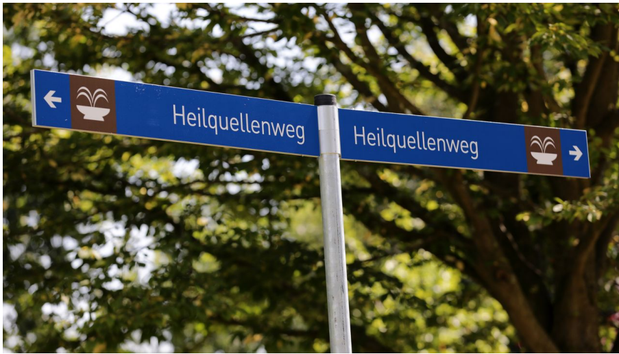
Bad Soden-Salmünster - Kurpark - Wegebeschilderung