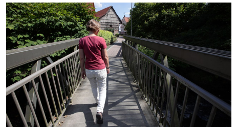
Bad Soden-Salmünster - Heilquellenweg