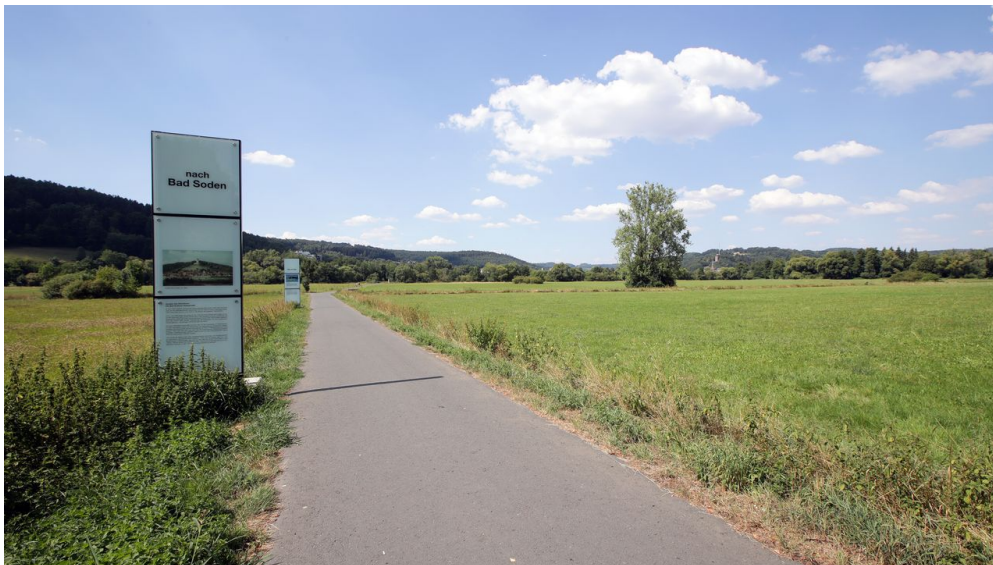
Bad Soden-Salmünster - Heilquellenweg