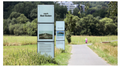
Bad Soden-Salmünster - Heilquellenweg