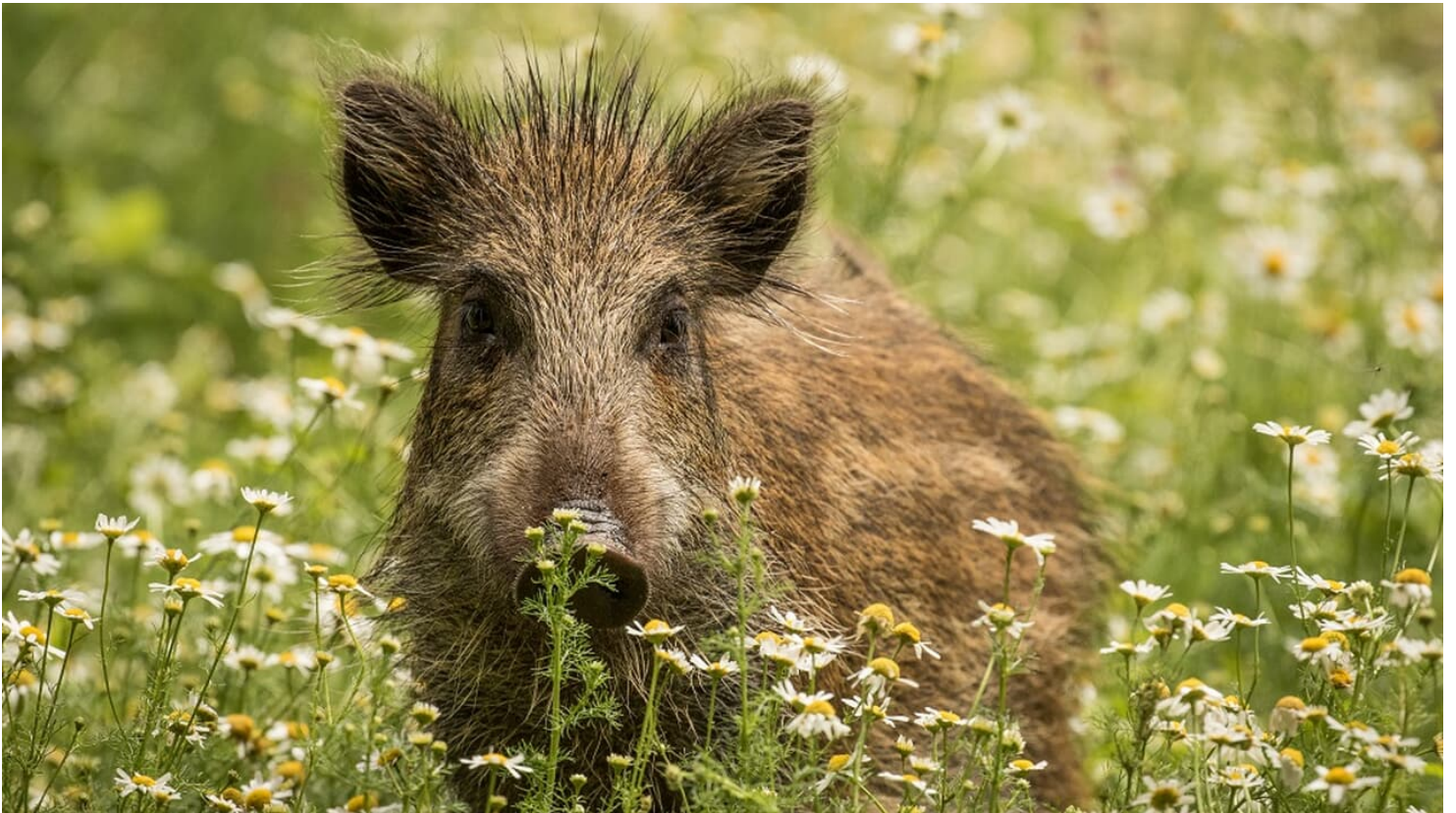
Wildschwein in Blütenwiese