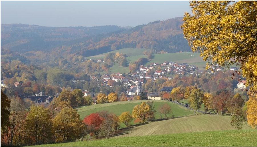
Gersfeld im Herbst: Blick vom Heilklimaweg nach Gersfeld