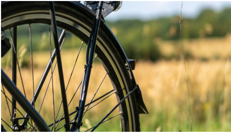
Ausflug mit dem Fahrrad_Grenztour 2_Sh-Tourismus_MOCANOX.jpg