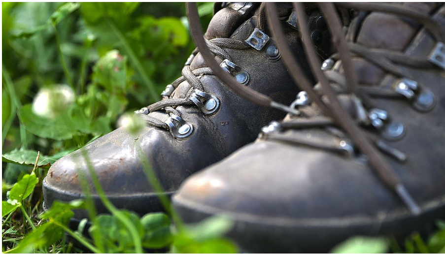
walking_boots-6313966_1920_Andreas Glöckner_Pixabay.jpg