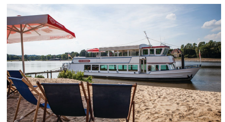
Schiff Schiedersee.jpg