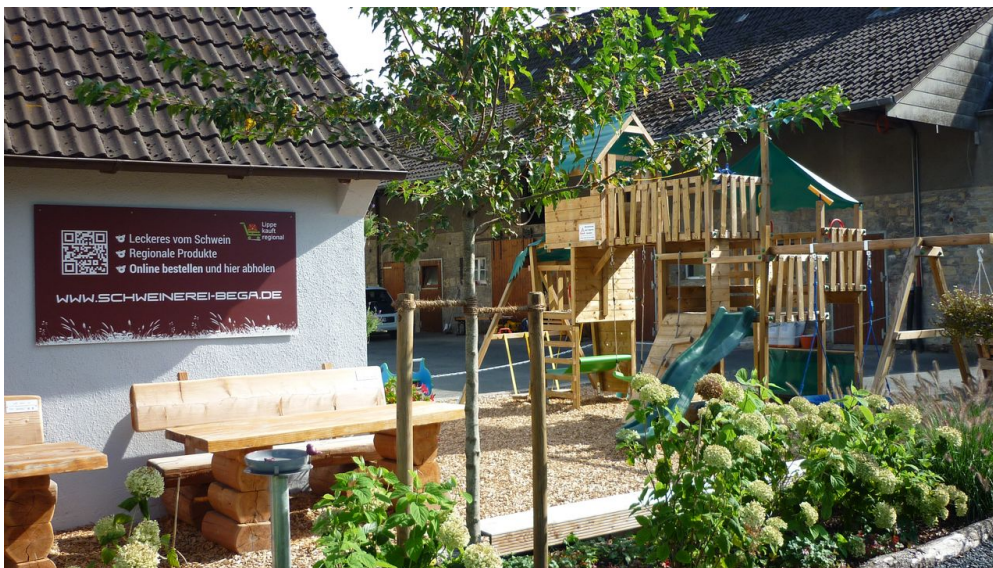
Schweinerei Ehlert 3 CC BY-SA - LTM.JPG - - j.wisomiersky@kreis-lippe.de