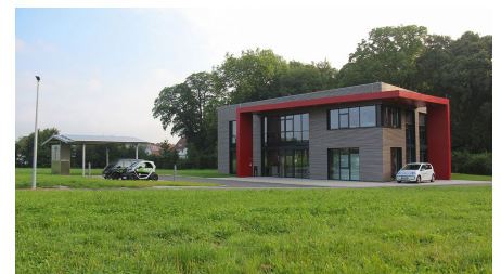
Innovationszentrum CC BY-SA - LTM.jpg