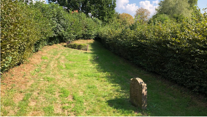
Jüdischer Friedhof Bega