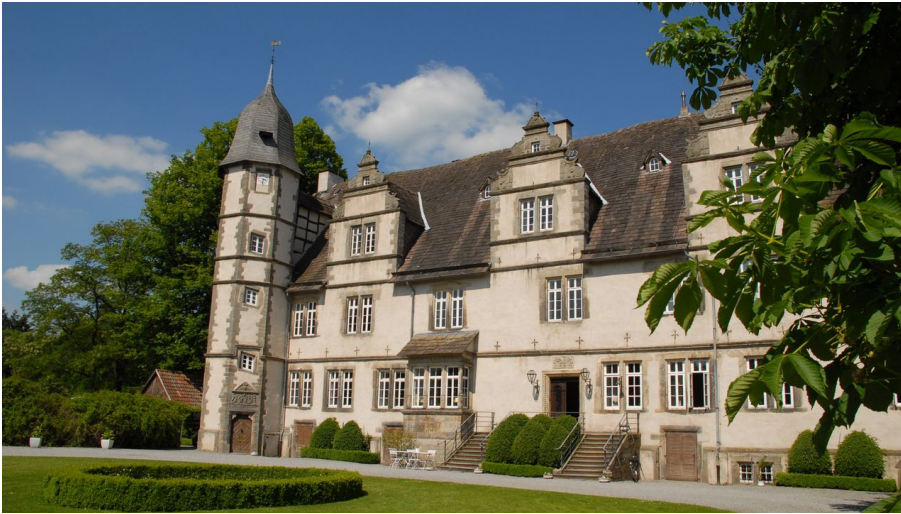
Schloss Wendlinghausen