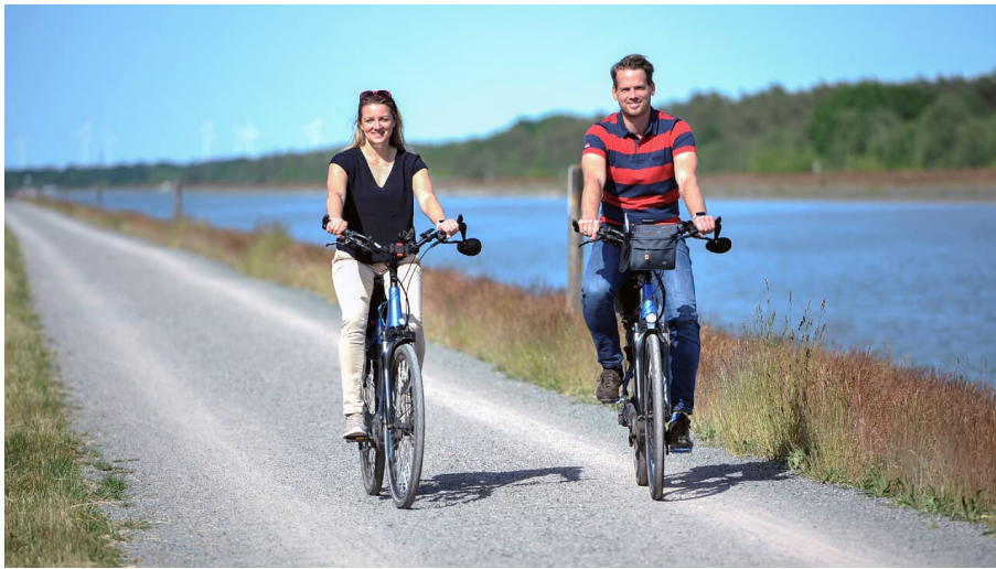
Mit dem Fahrrad am Kanal