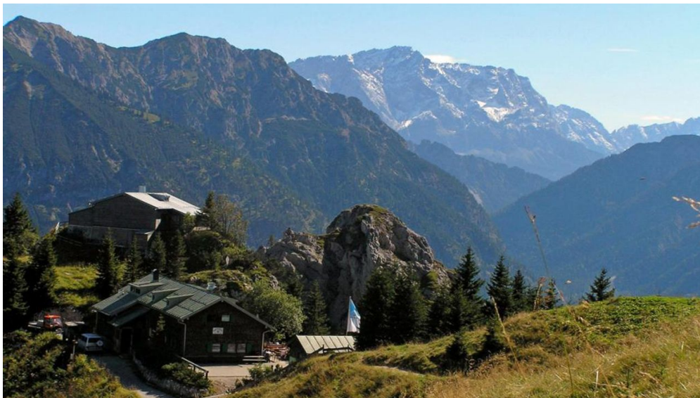
Mountainbiketour - Pürschling