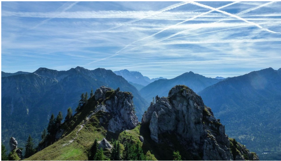
Pürschling Blick Zugspitze