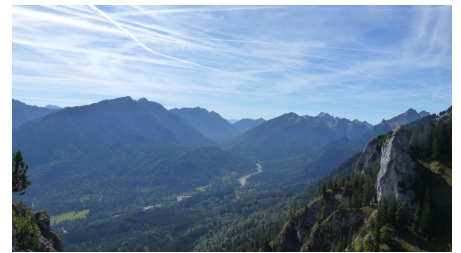
Pürschling Blick ins Graswangtal