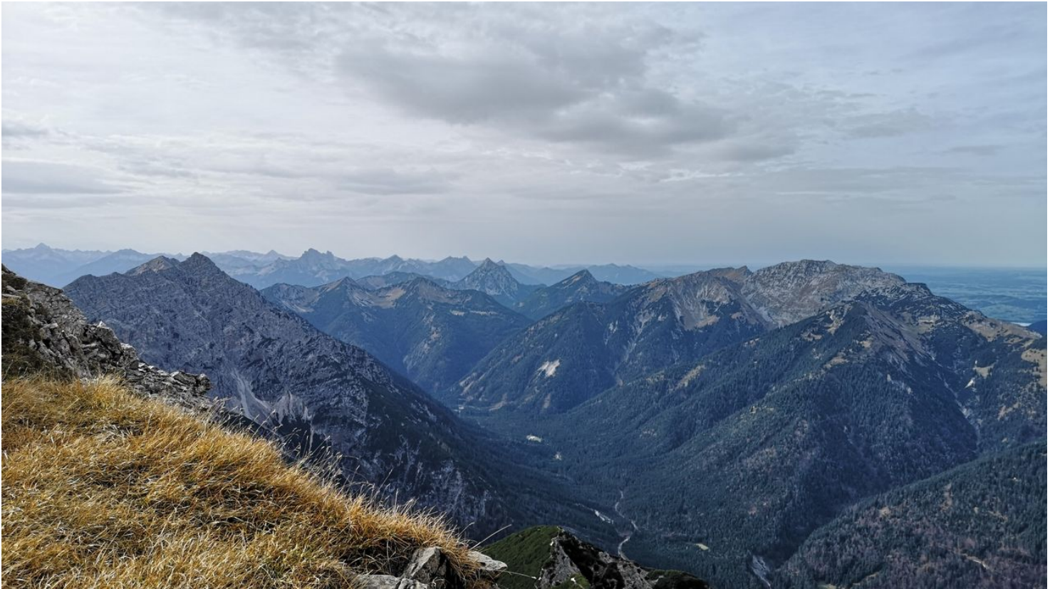
Naturpark Ranger, Naturpark Ammergauer Alpen