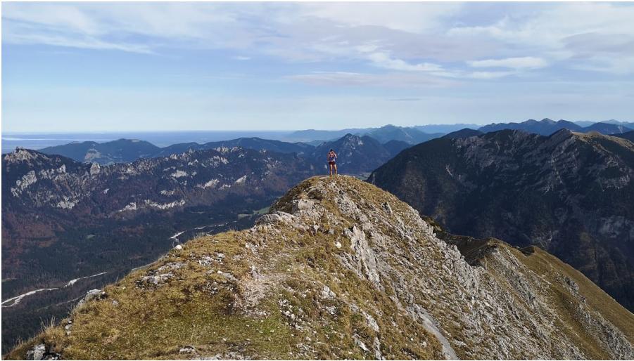
Naturpark Ranger, Naturpark Ammergauer Alpen