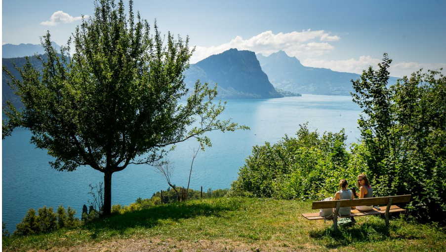
outsideisfree.ch, Schwyzer Wanderwege