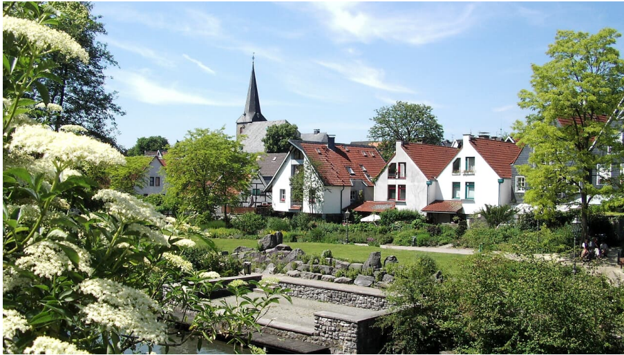
Blick über den Angergarten in Wülfrath