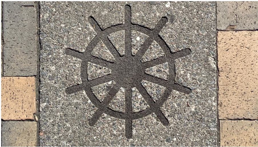
Tourismus Agentur Flensburger Förde GmbH