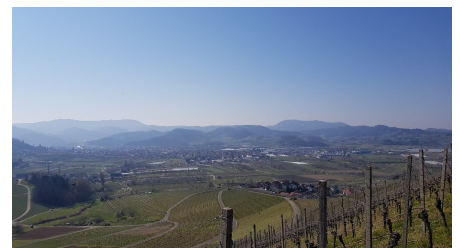
Aussicht in Richtung Fatima Kapelle