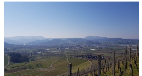
Aussicht in Richtung Fatima Kapelle