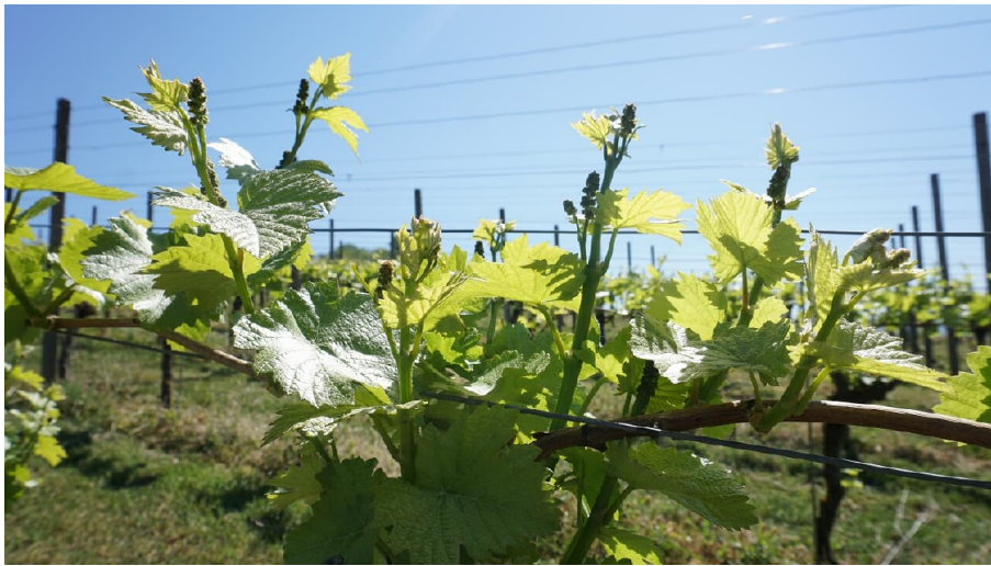
Reben - © Nationalparkregion Schwarzwald - Renchtal/Durbach