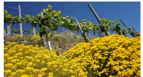
Reben mit Blumen