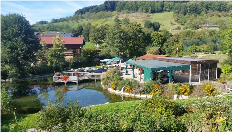
Blick von der Mummelseehalle in den Kurpark - © Tourist-Information Seebach, Nationalparkregion Schwarzwald - Achertal