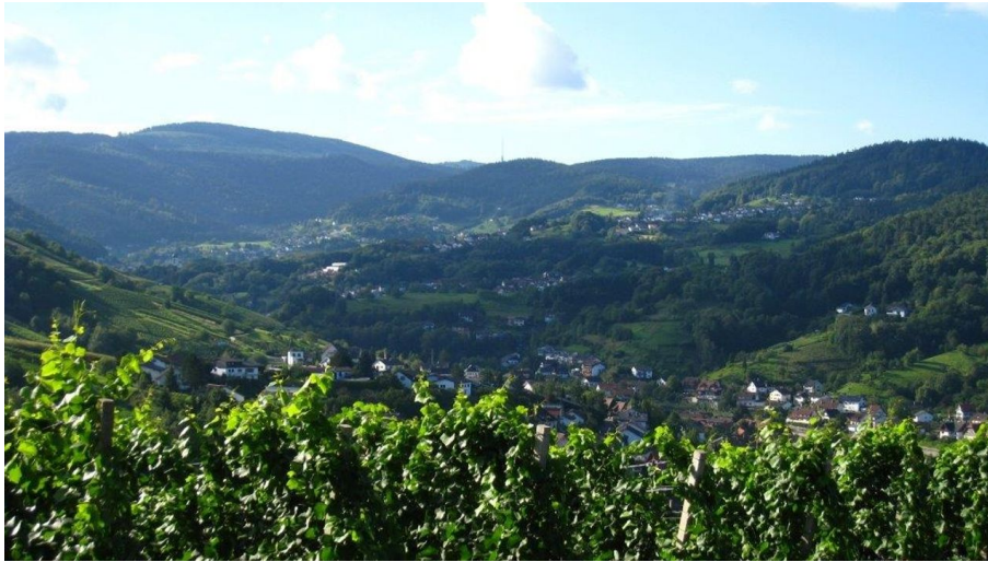
Elke Zimmermeyer, Bühl-Bühlertal-Ottersweier