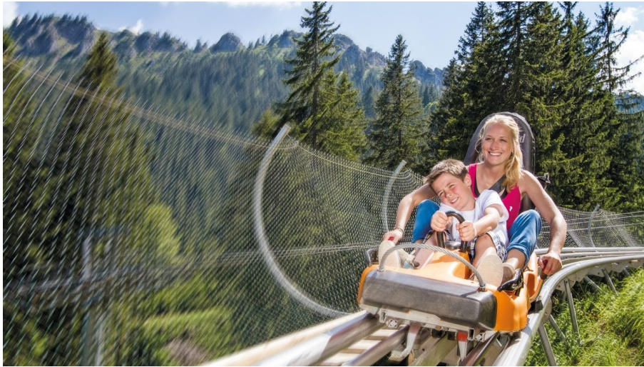
Alpine Coaster am Kolbensattel