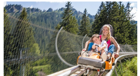
Alpine Coaster am Kolbensattel