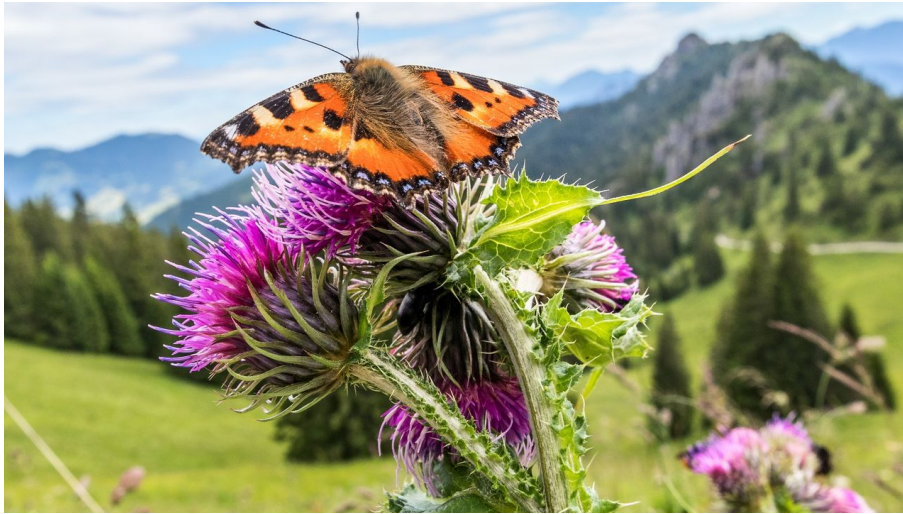
Schmetterling am Pürschling