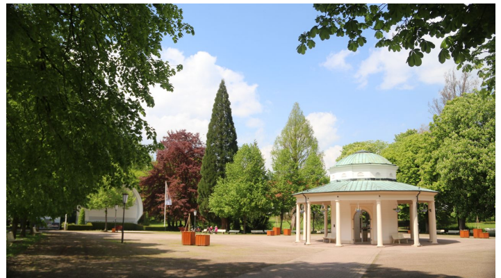
Brunnentempel mit Musikmuschel