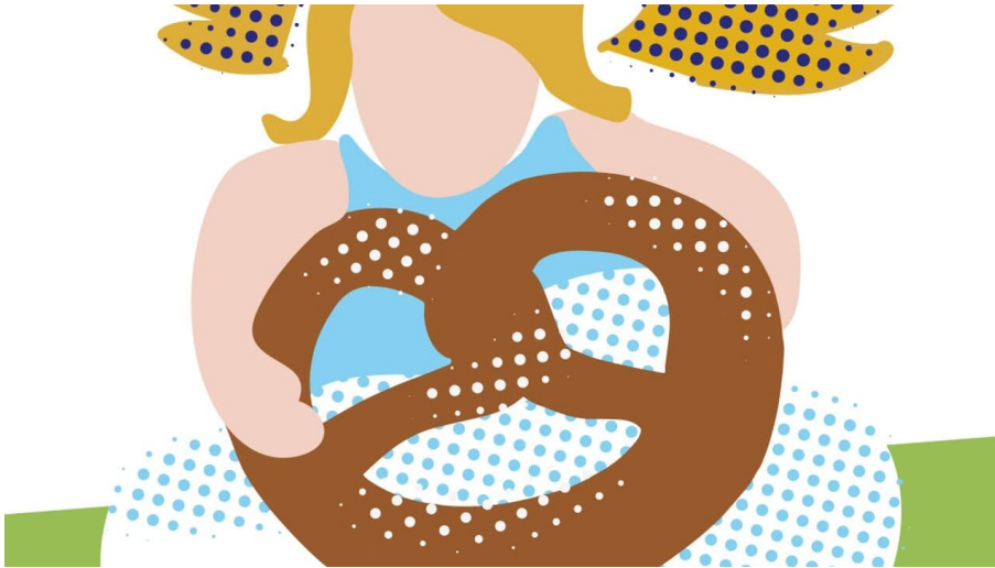
Tourensignet Himmlisch genießen