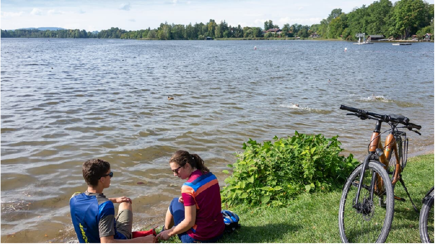
Der merlische Staffelsee