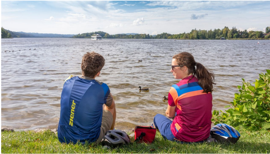
Pause am Staffelsee