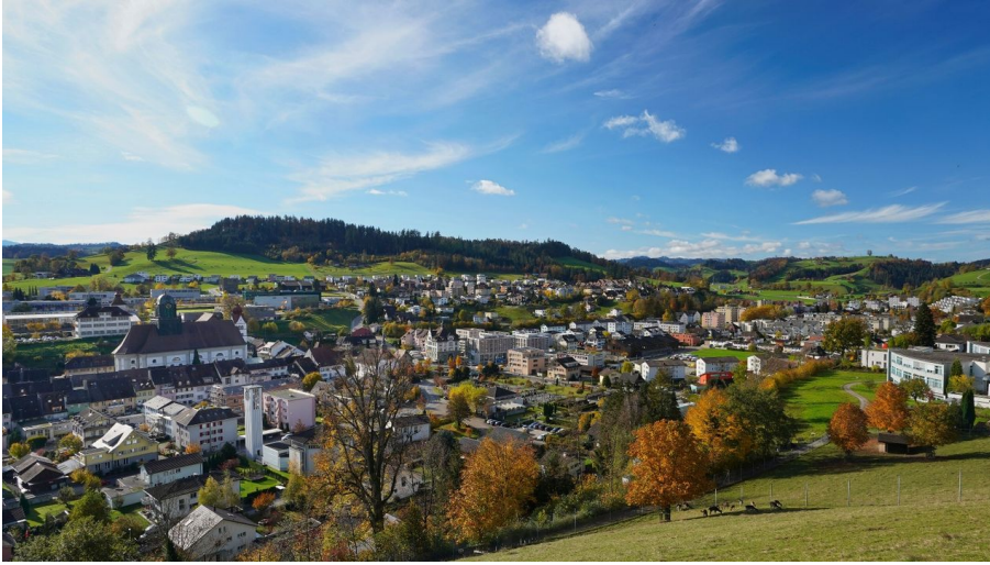
Aussicht vom Aussichtspunkt Gütsch