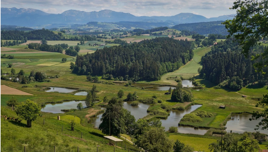
Blick auf die Weierlandschaft Ostergau