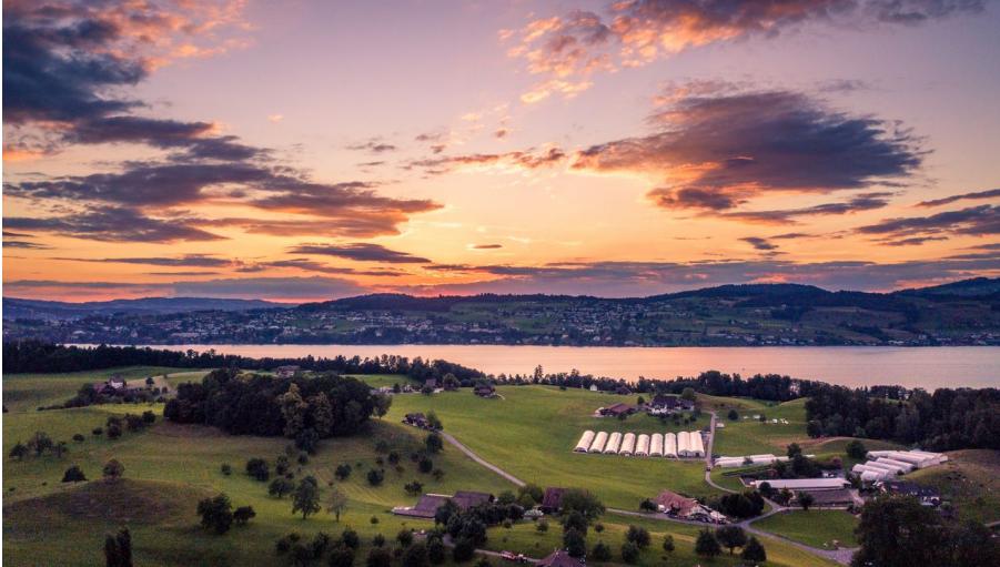
Blick auf den Küssnacherarm des Vierwaldstättersees