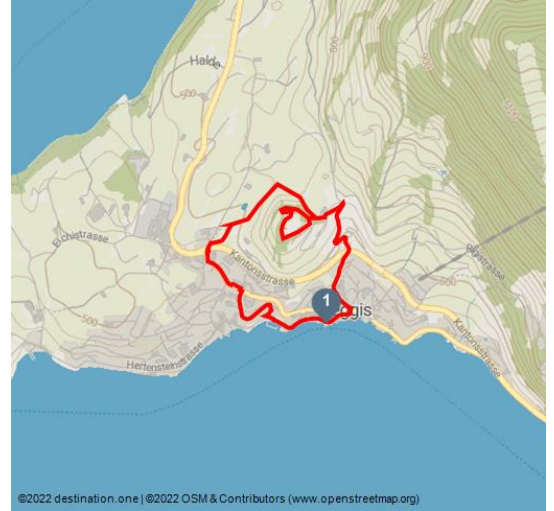
©2022 destination.one | ©2022 OSM & Contributors (www.openstreetmap.org)