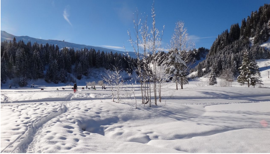
Seeblisee im Hoch-Ybrig