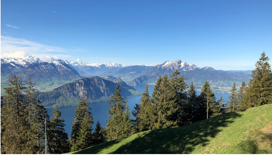
Aussicht auf dem Weg zum Känzeli