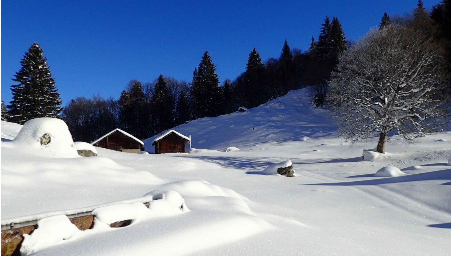
Schneeschuhtour Brünigpass-Ober Brünig-Lungern - © Obwalden Tourismus, Obwalden Tourismus