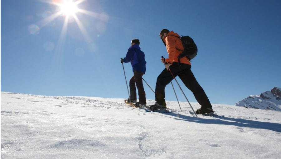
Schneeschuh-Laufen auf Melchsee-Frutt