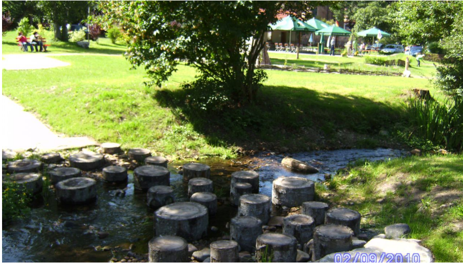
Über Stock, Stein und Wasser - Minigolfplatz Klosterreichenbach