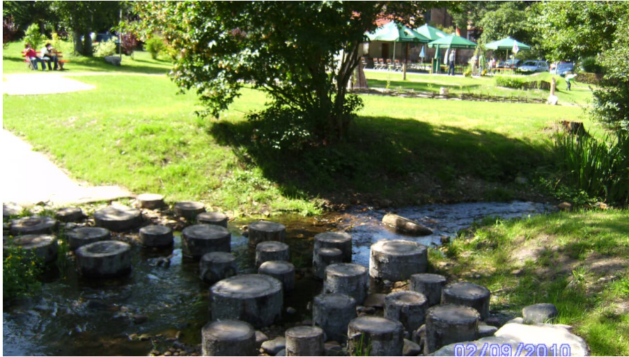
Über Stock, Stein und Wasser - Minigolfplatz Klosterreichenbach - © Baiersbronn Touristik, Nationalparkregion Schwarzwald - Baiersbronn / Murgtal