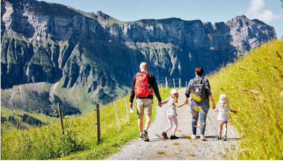
Wandern mit der Familie auf der Marbachegg