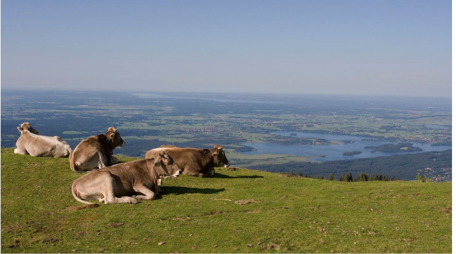
Kühe mit Aussicht