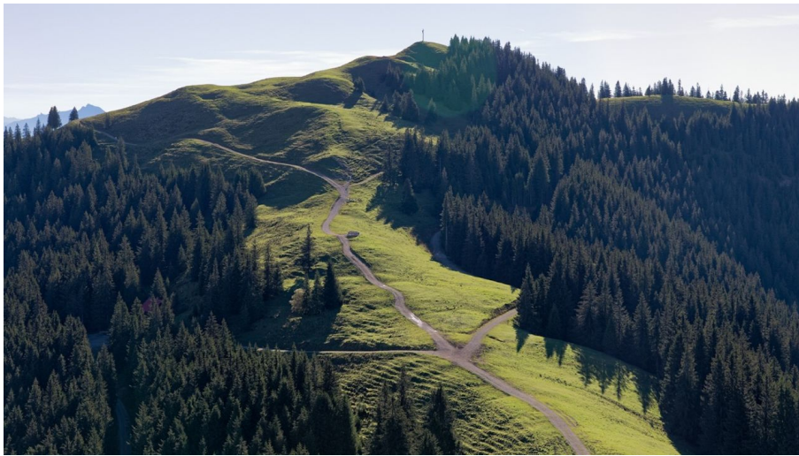
Mittleres Hörnle