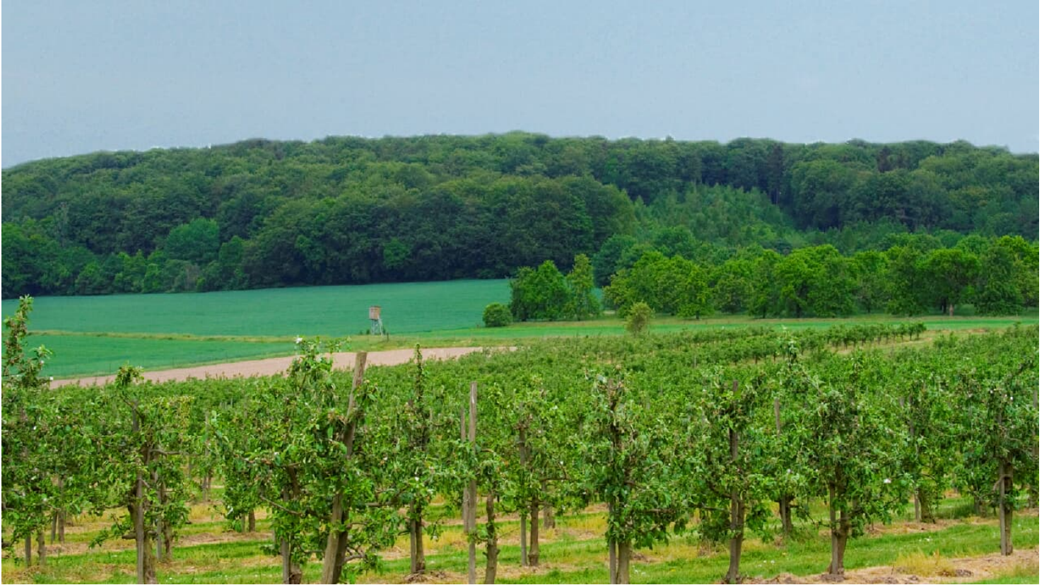
Stemweder Berg