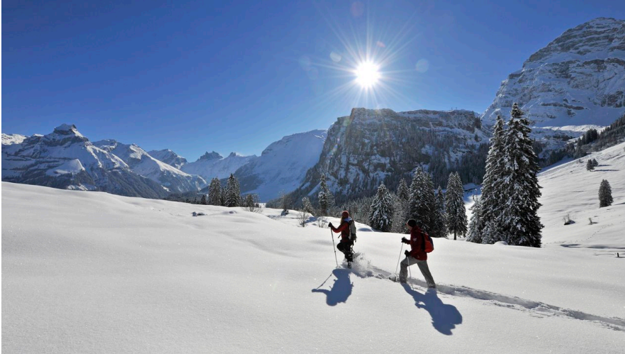
Engelberg - Titlis Tourismus, Engelberg-Titlis Tourismus