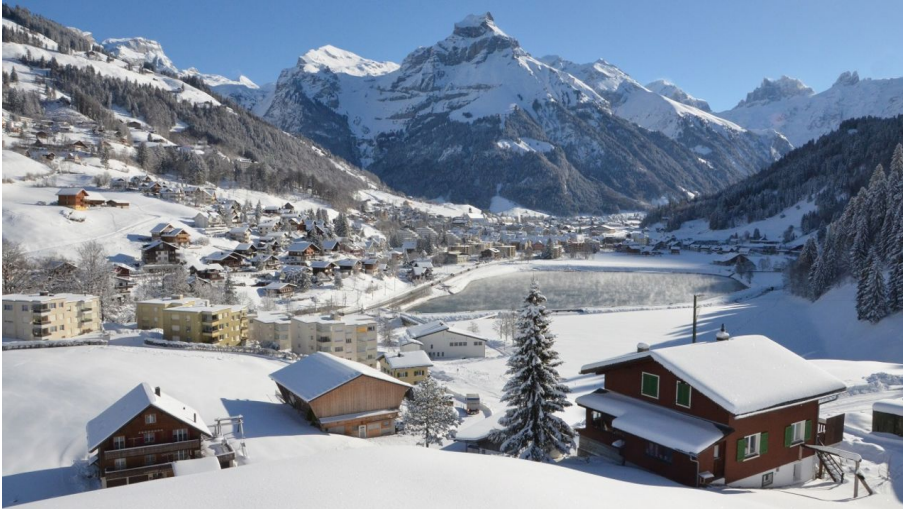
Bild von Örtigen