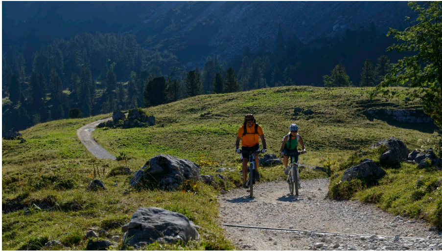
WEhn_086597.jpg - © go-images.com / Wolfgang Ehn