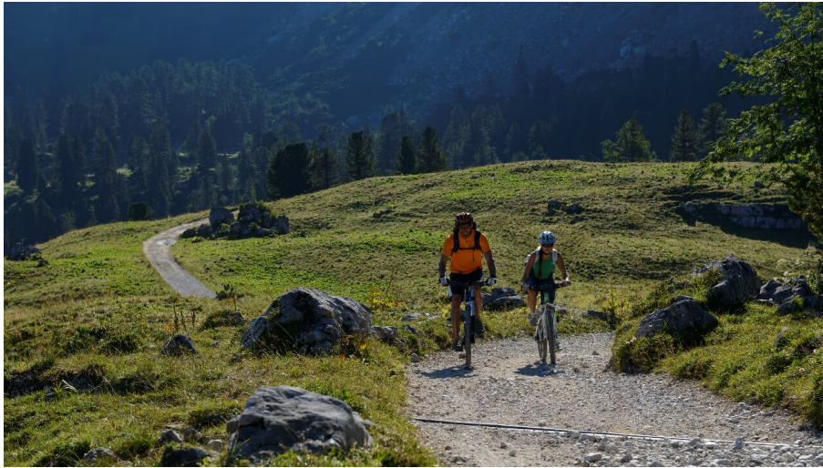
WEhn_086597.jpg - © go-images.com / Wolfgang Ehn