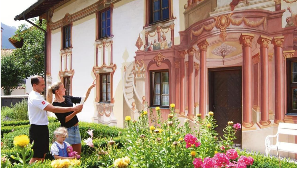
Wanderung - Historisches Oberammergau