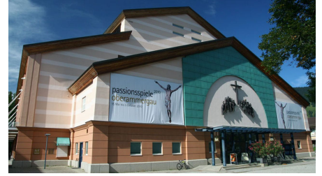
Frontseite Passionstheater