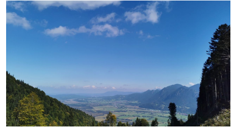
Naturpark Ranger, Naturpark Ammergauer Alpen