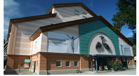
Frontseite Passionstheater