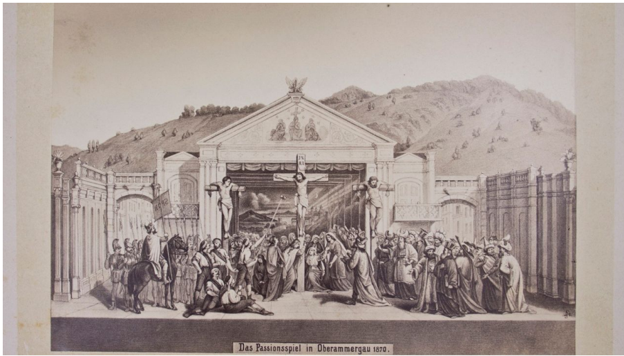
Das Passionsspiel in Oberammergau 1870. Gemeindearchiv Oberammergau, Naturpark Ammergauer Alpen