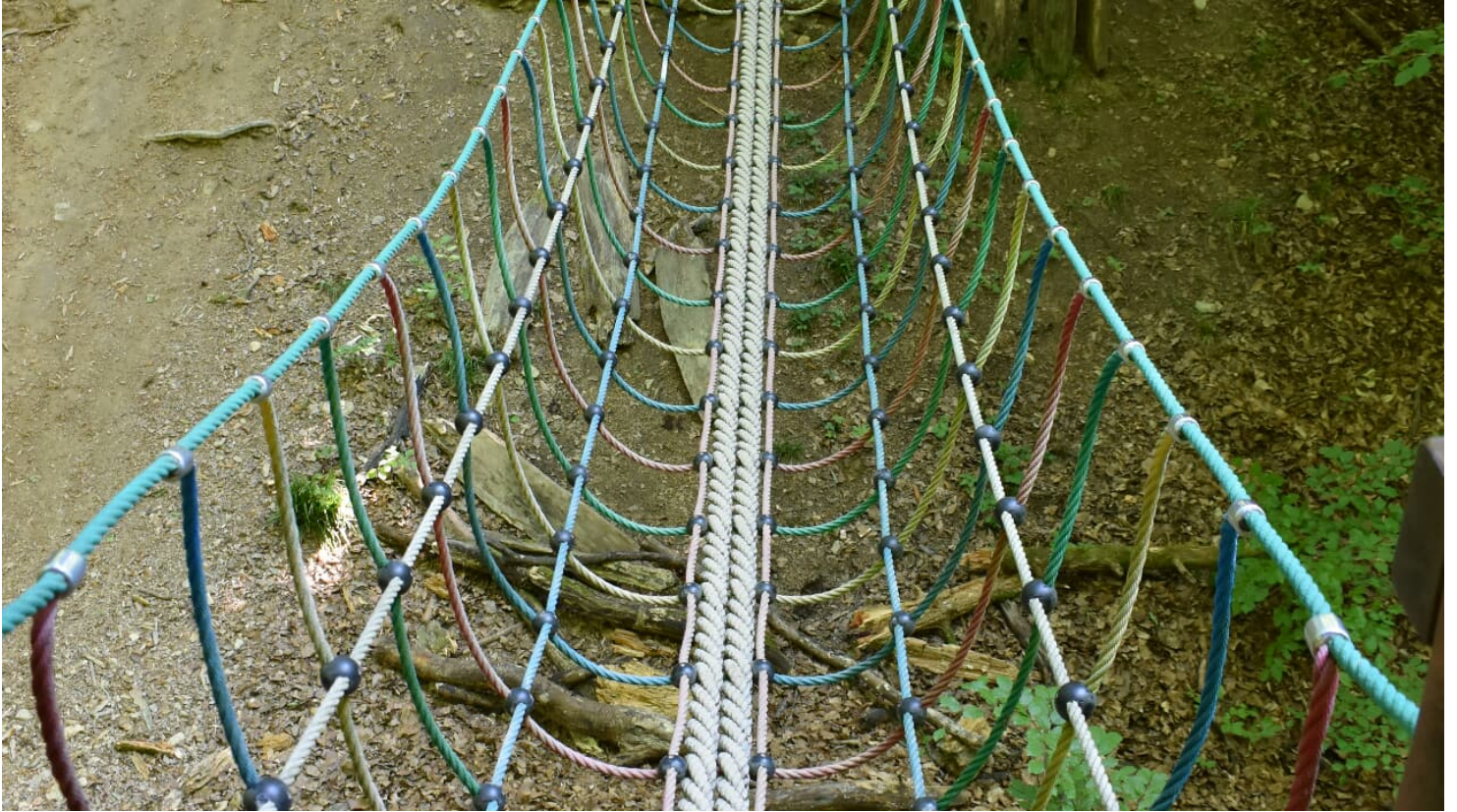
Hängebrücke entlang des Weges