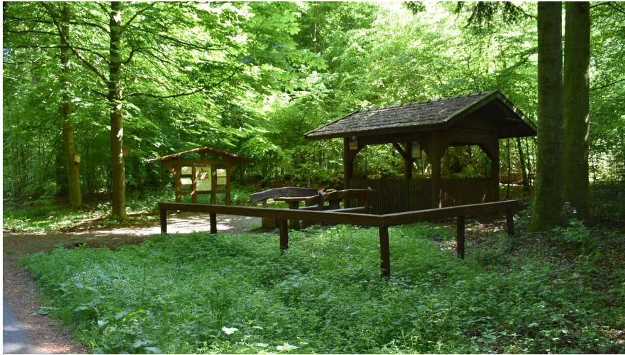
Rast- und Erlebnisplatz