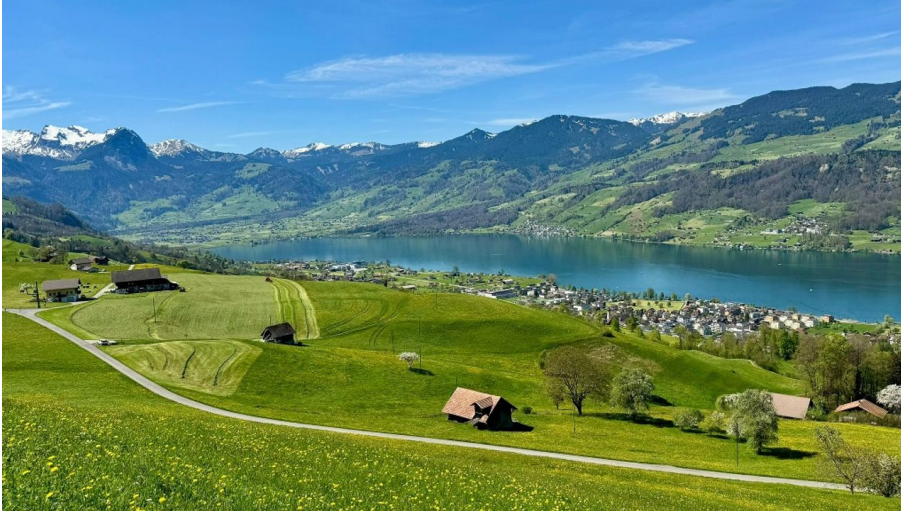
Blick über den Sarnersee