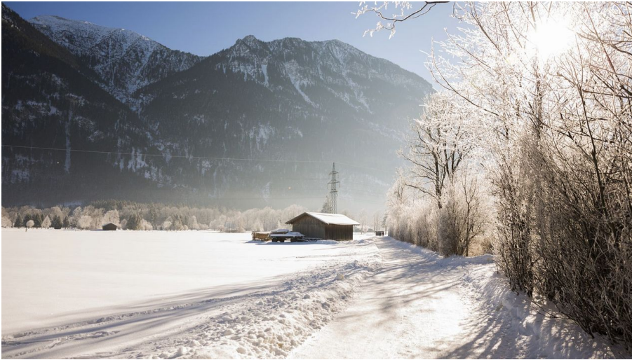
Winterwanderung von Oberau über Röhrlebach nach Farchant