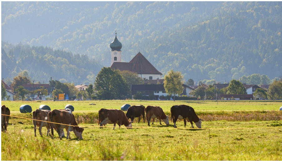
Eschenlohe im ZugspitzLand